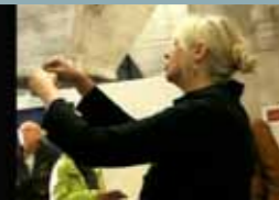
„VOR DEM HÖLLENTOR“