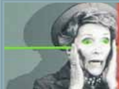
„AUGE UND OHR“