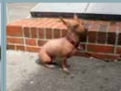
„NACKTER SPION AUF DEM DACH“