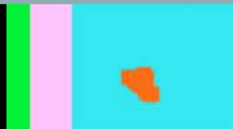
„ÜBERWACHUNG“ | „MATERIALBEWEGUNG“