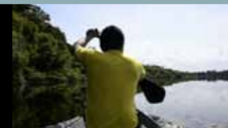
„SEEN AND UNSEEN“