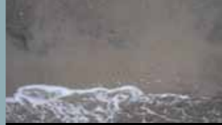
„TO SEE OR NOT TO SEE“ | „SIMULACRE“ | „TO SEE SEA“