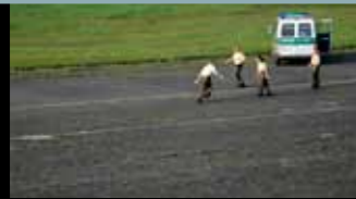
„ABSEITS“ | „AUGEN AUF“